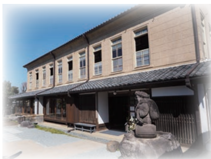
近代産業遺産 宮光園 〒409-1313 甲州市勝沼町下岩崎1741 TEL 0553-44-0444